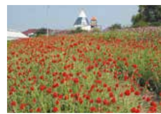
パルシェ香りの館