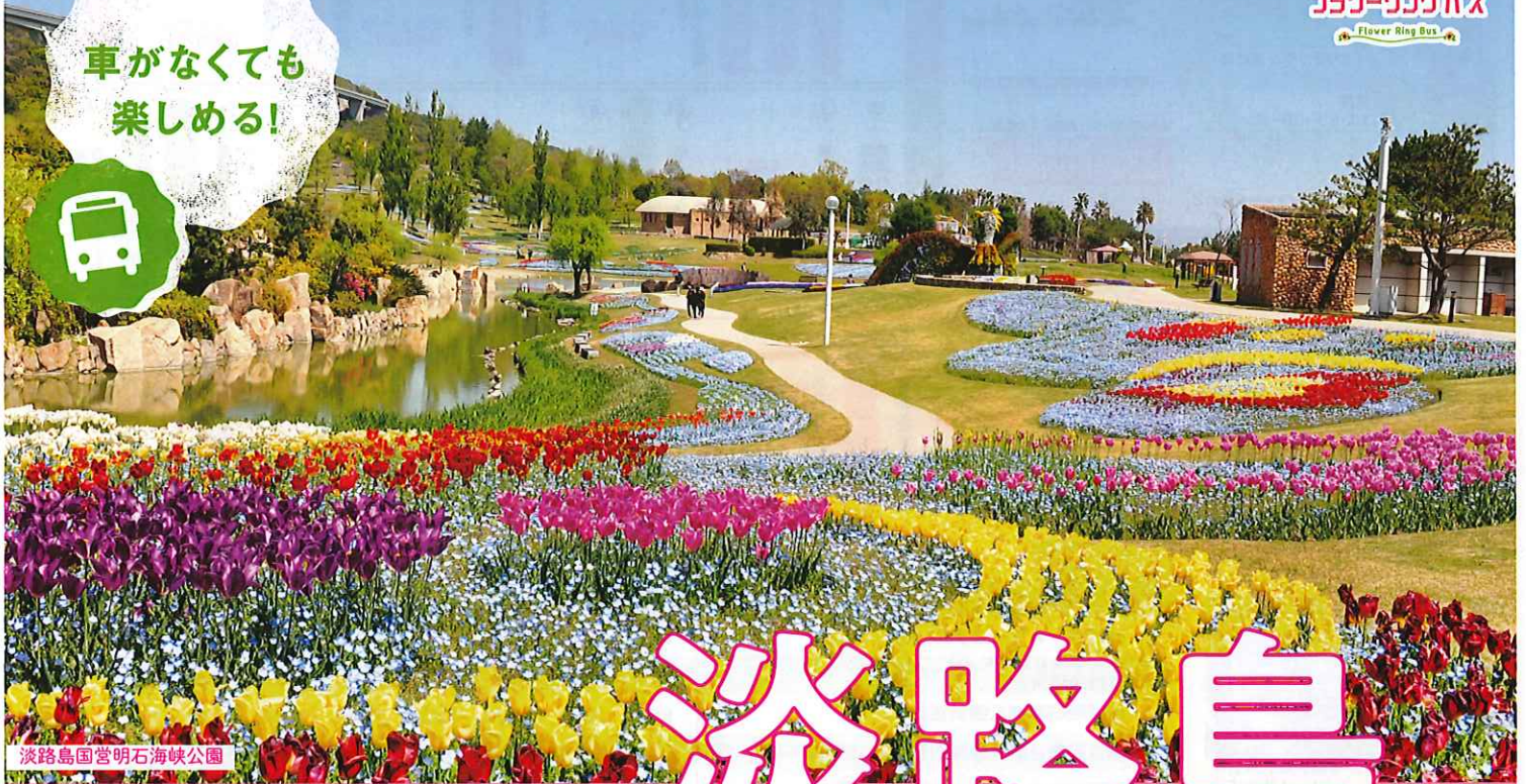
淡路島国営明石海峡公園