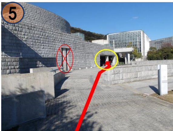
⑤ 道なりに進むと左手に建物への入り口が見えてきます。