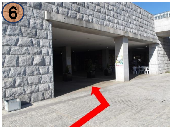
⑥ 建物の中へ進みます。