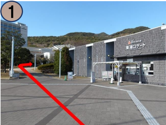
② バスを降りて国営明石海峡公園東浦口ゲートを右手に見ながら直進し、つきあたりを右方向に進みます。