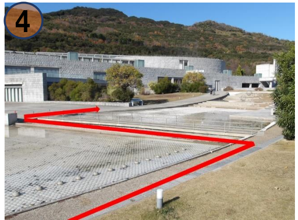
④ 貝の浜に架かる橋を渡り、右方向に進みます。