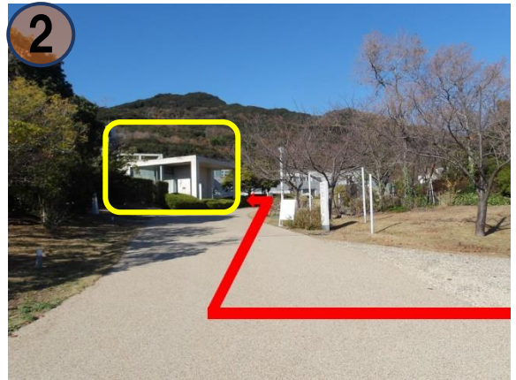
① 左手に見える建物(地下駐車場のエレベーター)を過ぎてすぐ左に曲がります。